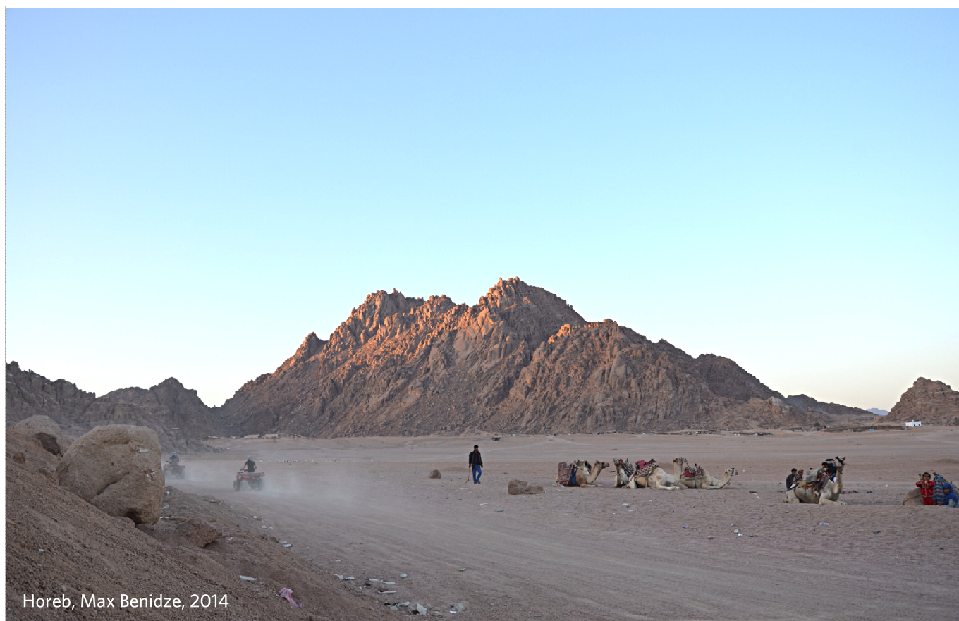
Horeb, Max Benidze, 2014

Het woordpaar 'liefhebben en haten' wordt dus zowel voor de HERE als voor zijn volk gebruikt. Daarmee is het in de Bijbel volop verbondsterminologie.