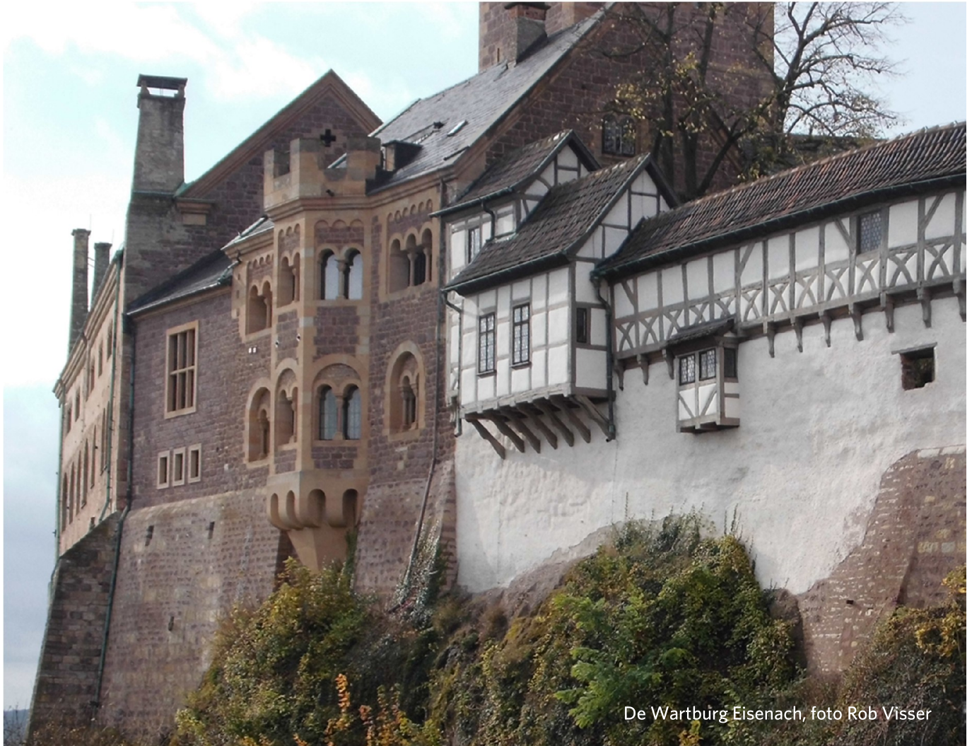
De Wartburg Eisenach

gereformeerd maandblad voor toerusting en informatie