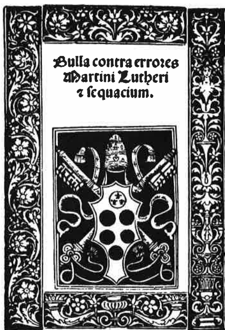
Bul 15 juni 1520, waarin Luther met de ban bedreigd werd

Luther staat voor de rijksdag op 17 en 18 april 1521. In Karel V, die de rijksdag leidt, verheft zich nog eenmaal het middeleeuwse politiek-religieuze ideaal: staat en kerk als een machtige eenheid. Tegenover deze koning staat een man