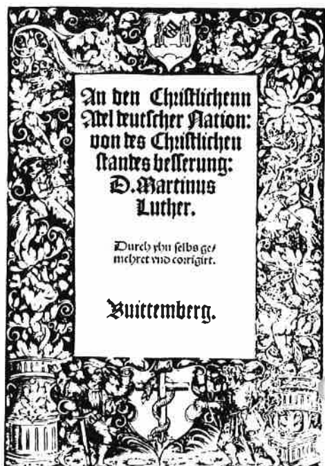
Titelblad: Aan de christelijke adel

Het eerste geschrift heet: Aan de christelijke adel der Duitse natie, over de verbetering van de christelijke samenleving . Luther heeft scherp gezien hoe de Duitse natie door de tirannie van de paus wegzinkt in geestelijke ellende. Vanuit het nieuw ontdekte Evangelie wijst hij wegen tot verbetering van de christelijke samenleving. De romanisten, aldus