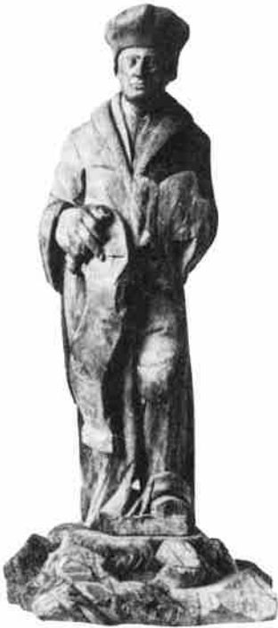
Erasmus van Rotterdam (Schegbeeld van een Nederlands Kerveel)

zijn boek Over de geknechte wil . Erasmus blijkt de kern van Luthers theologie te hebben geraakt. Luther zegt het zelf en prijst dit in Erasmus. En in zijn antwoord zet hij de diepste motieven van zijn theologie uiteen.