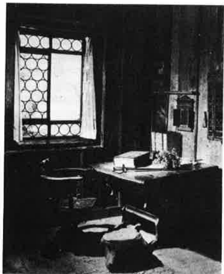
Werkkamer op de Wartburg

Als de verwarring in Wittenberg al maar groter wordt, besluit Luther met gevaar voor zijn leven naar Wittenberg terug te keren. Op 6 maart 1522 komt hij daar aan. Hij houdt dan zijn beroemde 'Invo-cavitpreken', waarin hij oproept tot liefde, zachtmoedigheid en geduld. "Men moet prediken en schrijven dat de mis, als die op deze (de oude) manier gehouden wordt, verkeerd is. Maar niemand moet er een ander met de haren bij vandaan slepen, men moet het God overlaten en alleen zijn Woord het werk laten doen", aldus Luther. En hij vat het tenslotte als volgt samen: "Prediken wil ik het, zeggen wil ik het, schrijven wil ik