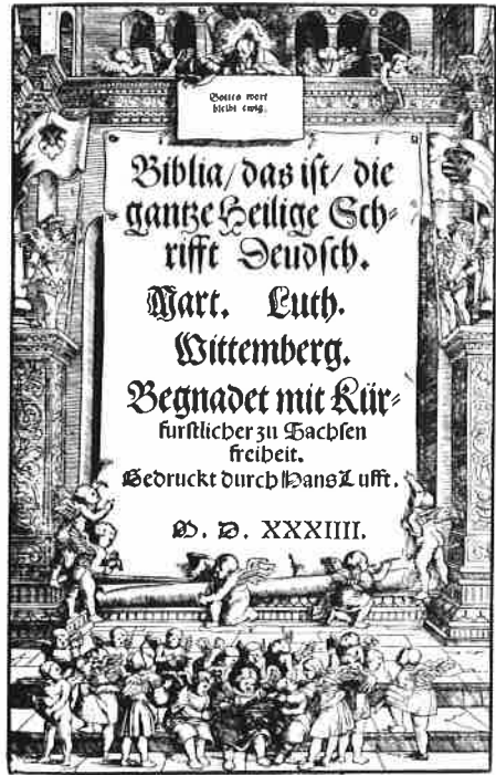
Titelblad van de volledige uitgave van Luthers bijbelvertaling 1534

Er zitten aan Luthers visie op de Schrift gevaarlijke kanten. Dat is ook het geval, als Luther onderscheidt tussen het geschreven en het gesproken Woord Gods